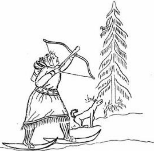
Охотник стреляет в белку из лука. деталь шторы (панно) XIX в.

Ненастье да мороз заставили наших предков, пришедших с юга, подумать и о теплой одежде. Где нужда, тут и подмога: леса полны были пушным зверем. Надо только изловчиться, а добыть мех можно было. Не угнаться человеку за быстрым зверьком - за лисицей или зайцем, не одолеть ему силача медведя.