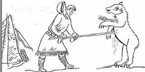
Охота с луком и рогатиной на медведя. Деталь шторы (панно). XIX в.